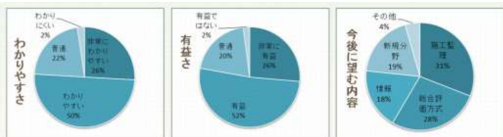
H27年度に開催されたセミナー参加者へのアンケート結果