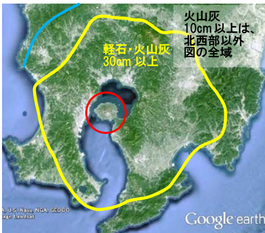
桜島 軽石火山灰の分布 (参考資料:桜島広域防災マップ)

(軽石・火山灰は全方位に同時に降ることはありません。限られた方向に降ってきます。)