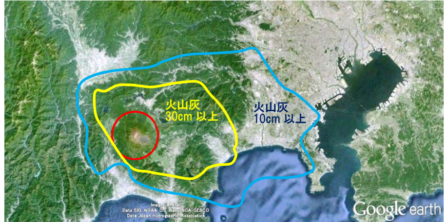
富士山と降灰予想図